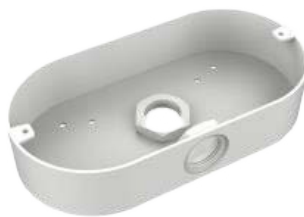
XLGNXJB201 - Junction Box 202 mm × 105 mm × 40 mm

*Designs et spécifications sont sujets aux changements sans préavis